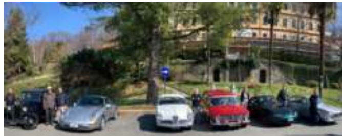
UNA DOMENICA MATTINA DIFFERENTE DALLE ALTRE Due immagini della visita dell'Amsap alla Domus Laetitia

La Domus Laetitia è una Cooperativa di Solidarietà Sociale che, dal 1984, si occupa di tematiche relative alla disabilità intellettiva, relazionale e mentale. Negli anni la struttura ha sviluppato tutta una serie di servizi (residenze, centri diurni, integrazione scolastica, assistenza domiciliare, assistenza educativa territoriale, inserimento lavora-