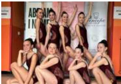
DUE PRIMI E UN SECONDO POSTO Le tre squadre della Pietro Micca impegnate a Chiari