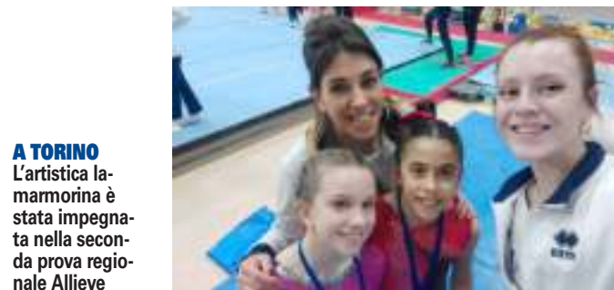
A TORINO L'artistica la marmorina è stata impegnata nella seconda prova regionale Allieve

BIELLA (rar) E' stata l'artistica femminile a tenere alto l'onore della Ginnastica La Marmorina la scorsa domenica, in occasione della seconda gara regionale Allieve andata in scena a Torino.